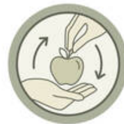
ECONOMÍA CIRCULAR Y SOLIDARIA