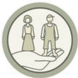
VALORES HUMANOS Y SOCIALES