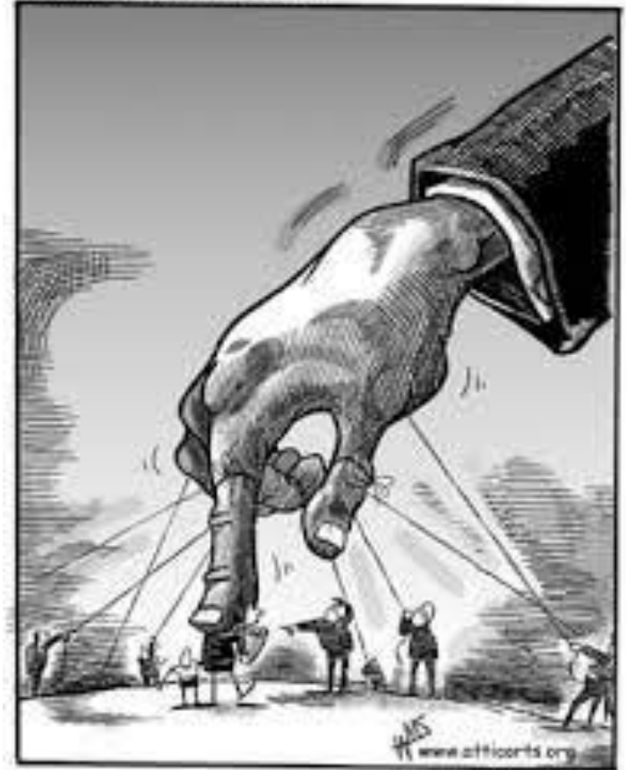
Trust in the Invisible Hand