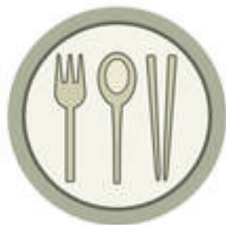
CULTURA Y TRADICIONES ALIMENTARIAS